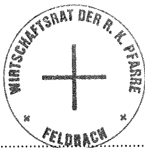
Siegel des Wirtschaftsrates